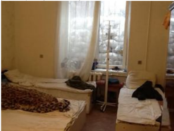
Den Krieg bisher überlebt. Damit es so bleibt, schützen Sandsäcke ....