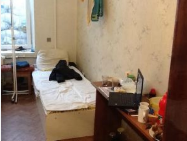
Ein Krankenhauszimmer in Donezk. Für mehr Bilder und Infos klick aufs Foto.

Опубликовано 30 марта 2025 года Франком Готтшлихом